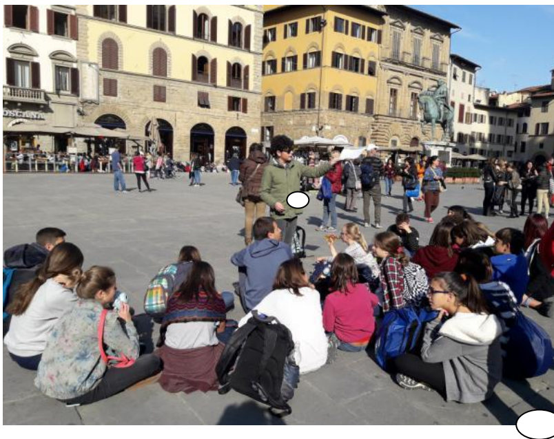
STUDENTS AT WORK

vengono organizzate gite in città d'arte italiane, escursioni nel nostro territorio, cene conviviali, presentazioni di lavori scolastici, concerti, drammatizzazioni, giochi didattici (es. The Treasure hunt)